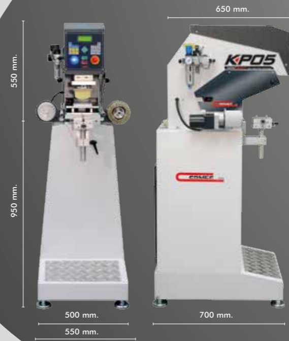
MINIPRINT KP05 1C with closed inkcup and ceramic ring ø 90 mm, steel bench and cleaning device.