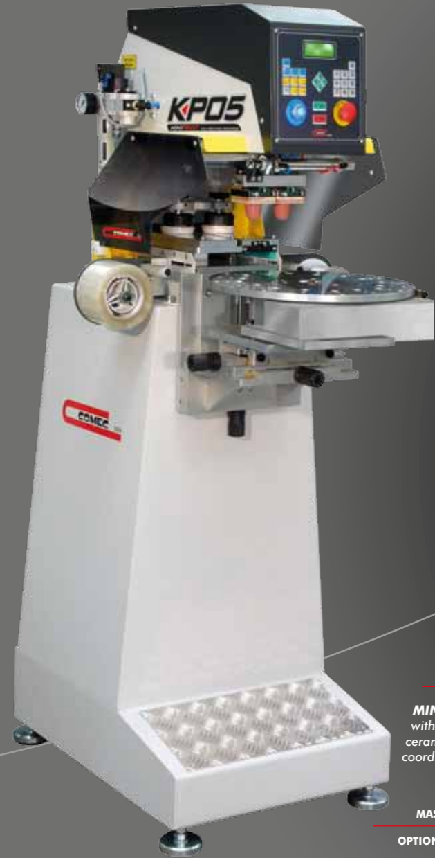
MINIPRINT KP05 2C RR ø 70mm Kapalı hazne, Seramik ringi, masası, temizleme aparatı, MVTC200 ayar tablası ve dönel tabla ile