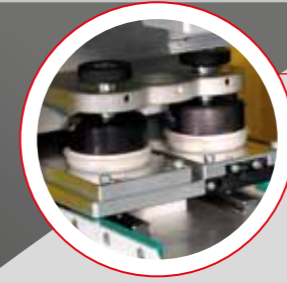
HERMETİK KAPALI HAZNE