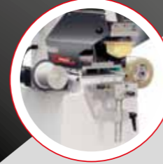
TEMİZLEME APARATI (Ops.) PAD CLEANING DEVICE (Opt.)

MINIPRINT KP05 works with ø 90 mm inkcups in one color version and ø 70 mm in 2 colors