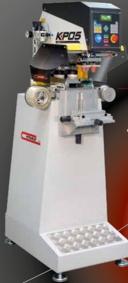
MINIPRINT KP05 2C RR ø 70mm Kapalı hazne, Seramik ringi, masası, temizleme aparatı ve MVTC200 ayar tablası ile