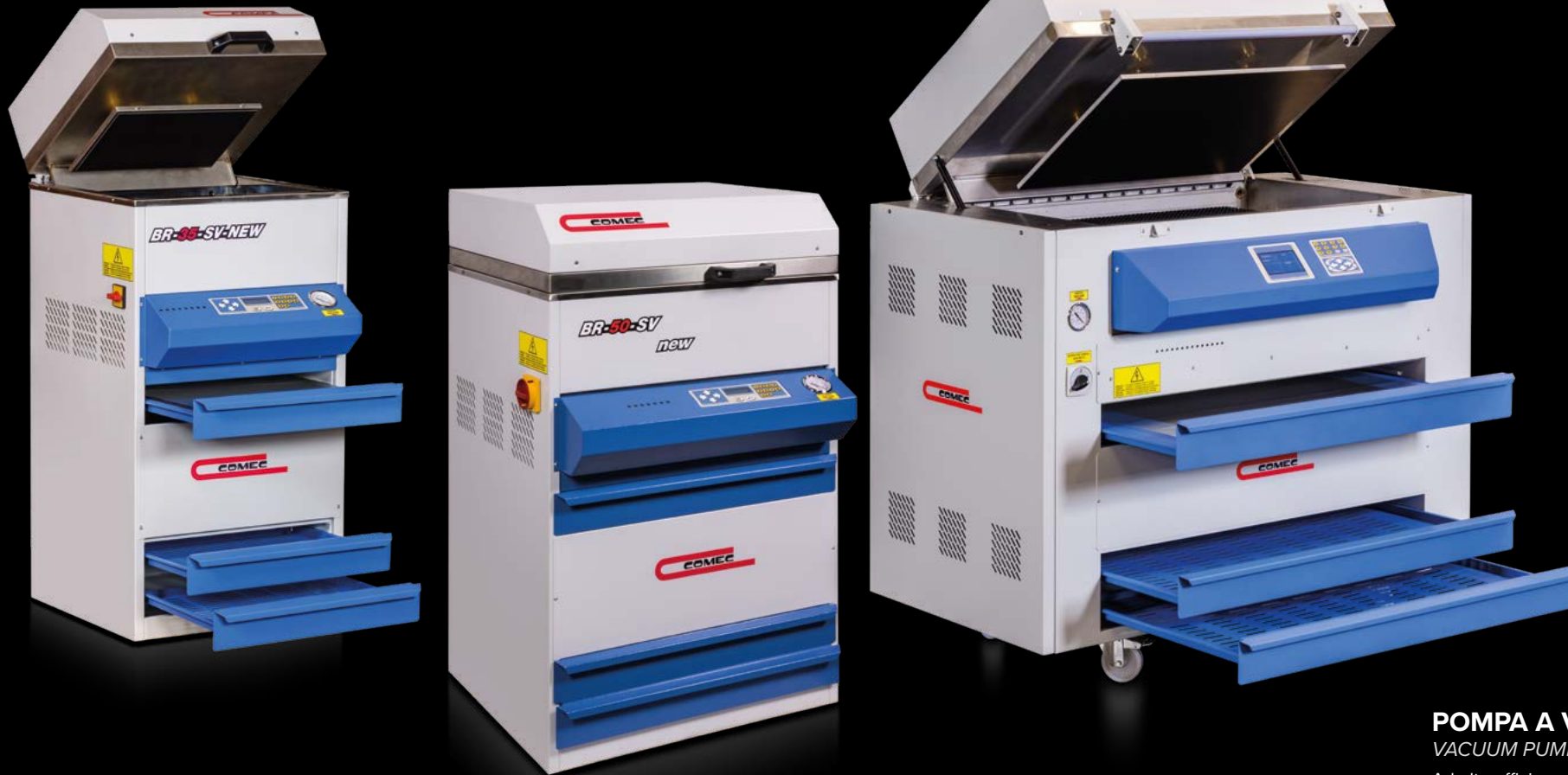
BR 35 SV New

Unlike manual devices, with this type of photoexposures is possible to perform all the operations to engrave a photopolymer cliché with a single machine, which includes UV exposure chamber with high efficiency vacuum pump, steel developing tank with thermostat and rotating magnetic plane, ventilated hot air drying oven. The models BR 50 SV New and BR 70 SV New are also equipped with additional UV lamps in the oven, for a more rapid drying of the cliché.