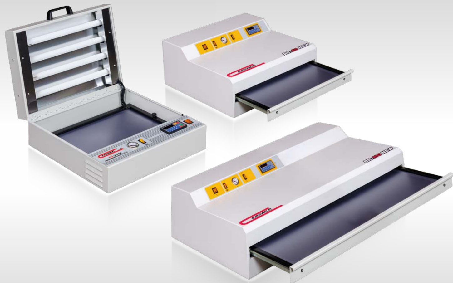
BR 35 M

The addition of the FE oven makes it possible to complete the equipment needed to develop the cliché independently.